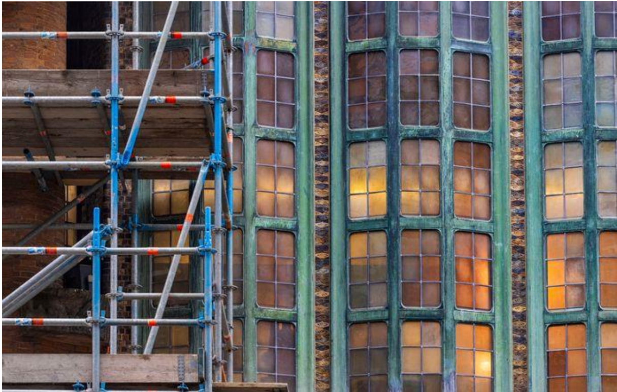
Bijenkorfrahmen worden gerenoveerd.

er scheuren in de lijsten of kozijnen en die lassen we dan dicht. Deze werkzaamheden voeren wij uit in onze eigen loods.”