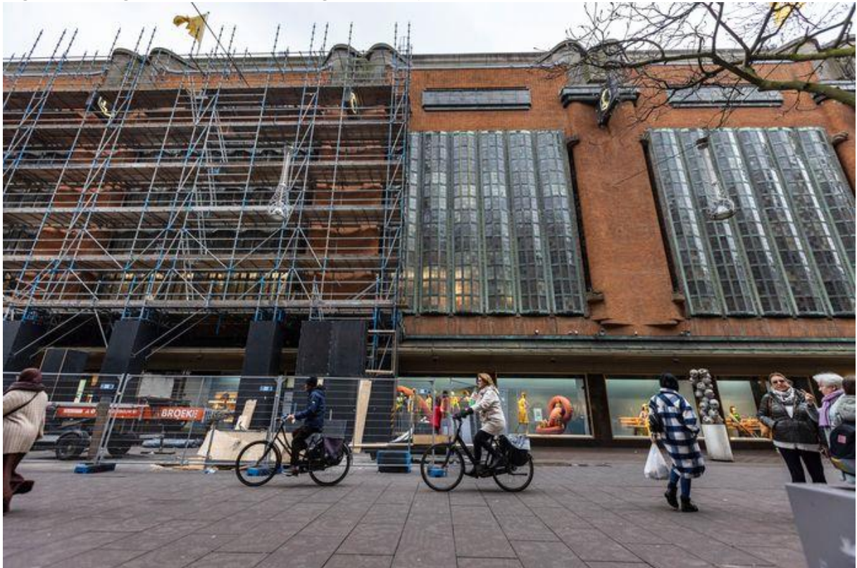
De Grote Marktstraat wordt behoorlijk in beslag genomen door de renovatie van de Bijenkorfgevel.