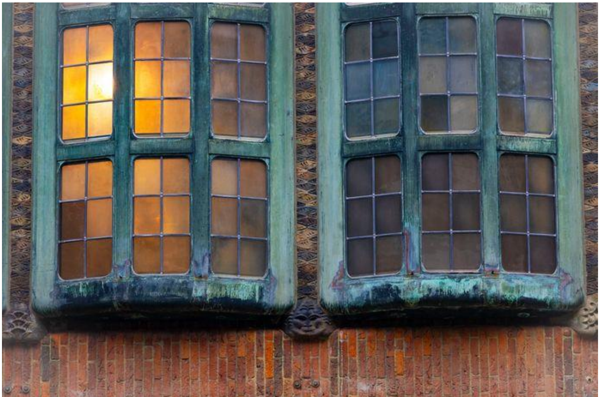
Bijenkorfrahmen worden gerenoveerd.