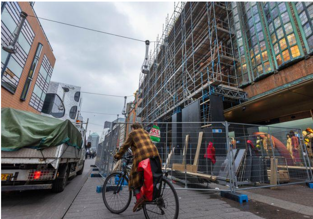
Bijenkorf. De Grote Marktstraat wordt behoorlijk in beslag genomen door de renovatie van de Bijenkorfgevel. (Den Haag 12-03-24)

Hoeveel het bouwproject daadwerkelijk kost, is onduidelijk. Projectleider Simoen kan daar geen antwoord op geven.