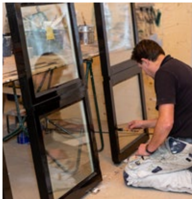
OP DE ORIGINELE KOZIJNEN ZATEN TOT WEL ACHTTTIEN LAGEN EN KLEUREN VERF