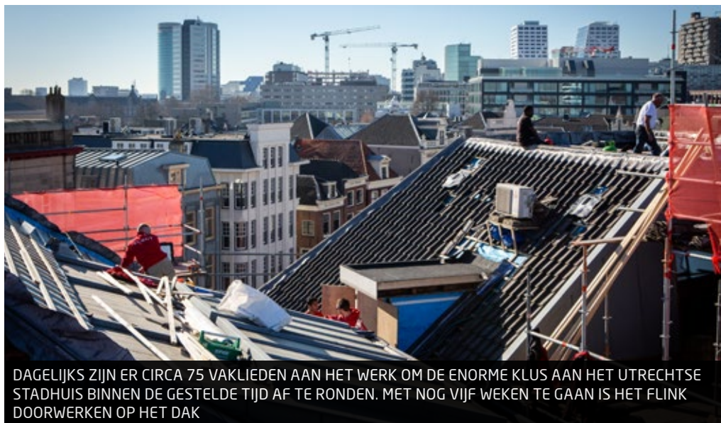
DAGELIJKS ZIJN ER CIRCA 75 VAKLIEDEN AAN HET WERK OM DE ENORME KLUS AAN HET UTRECHTSE STADHUIS BINNEN DE GESTELDE TIJD AF TE RONDEN. MET NOG VIJF WEKEN TE GAAN IS HET FLINK DOORWERKEN OP HET DAK