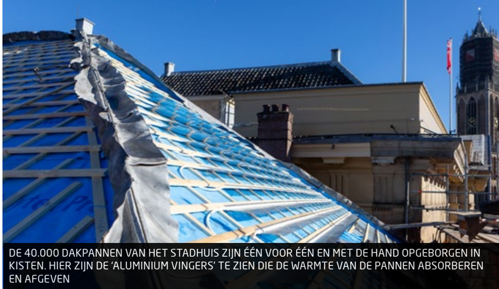
DE 40.000 DAKPANNEN VAN HET STADHUIS ZIJN ÉÉN VOOR ÉÉN EN MET DE HAND OPGEBOGEN IN KISTEN. HIER ZIJN DE 'ALUMINIUM VINGERS' TE ZIEN DIE DE WARMTE VAN DE PANNEN ABSORBEREN EN AFGEVEN