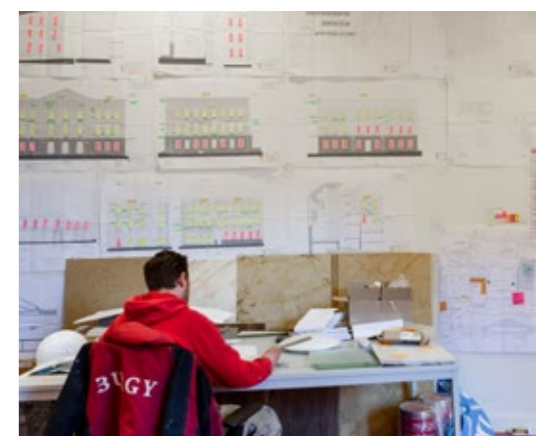
EEN MINUTIEUS UITGEWERKTE PLANNING IS BIJ DERGELIJKE PROJECTEN VAN GROOT BELANG