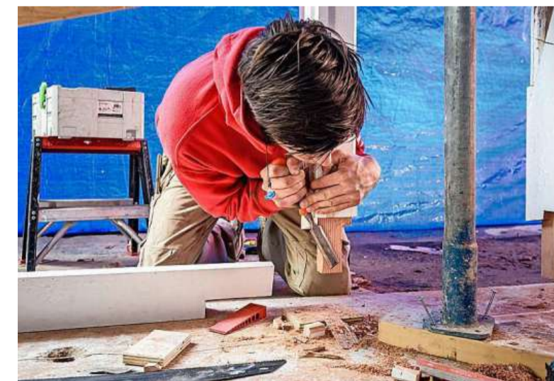
Werkzaamheden aan de Kiosk.