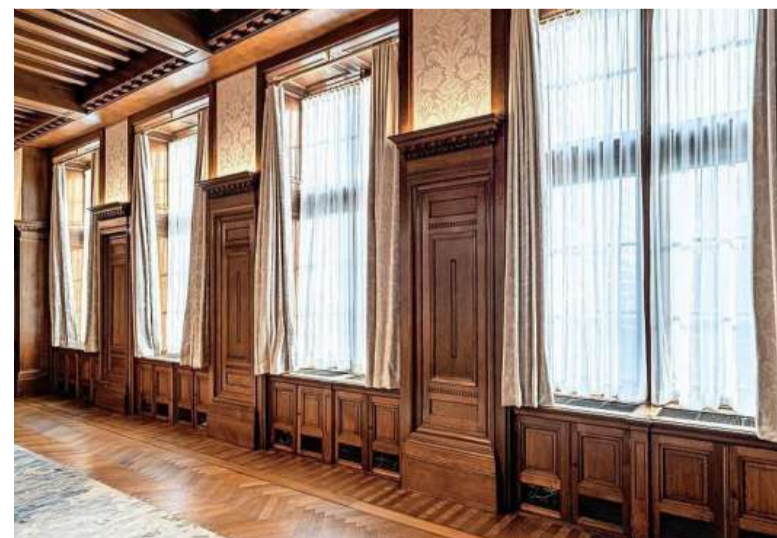
De stijkkamers van het Shell-gebouw