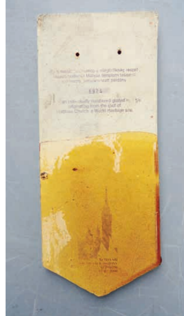
Originele daktegel afkomstig van de Matthiaskerk te Boedapest 1874-'96 met certificaatnr. 6974.

Ook een stad als Boedapest heeft heel veel gekleurde daken met daktegels, omdat die zich uitstekend laten leggen (lees: dekken) in patronen en verschillende kleuren (zie ook het artikel over de Matthiaskerk, elders in dit nummer).