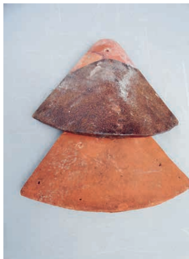
Hoekkeper tegel met spijkergaten in naturel rood en bruin verglaasd.