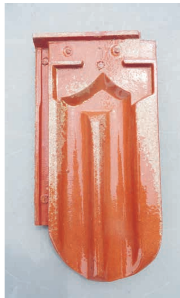
Daktegel in bruinglazuur met zij- en kopsluiting bestemd als enkeldekker.