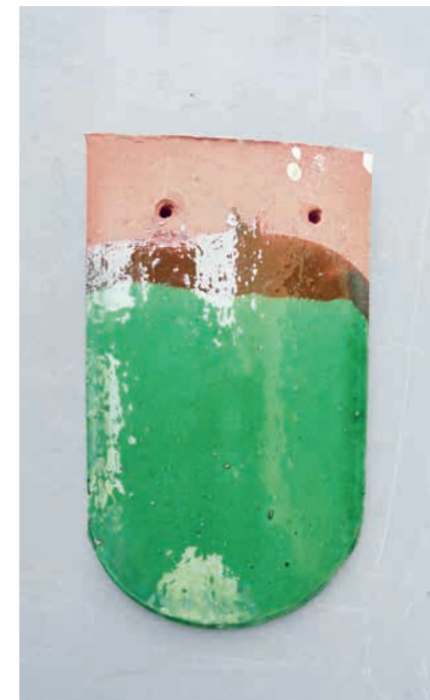
Groen verglaasde Beverstaarttegel met spijkergaten, bedoeld als zijbekleding.