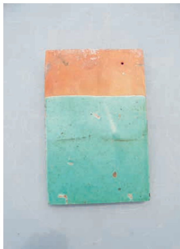
Rechthoekige daktegel 2/3 deel in zeegroen glazuur voor dubbele dekking.