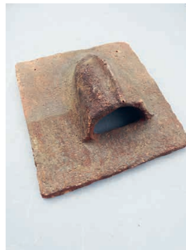
Bezande daktegel met ventilatiekapje. Fabriekaat dakpannenfabriek Van Oordt & Zn. Alpen a/d Rijn ca. 1910.

blauw gesmoord, verglaasd in zwart loodglazuur of groen. Let maar eens op de oudere panden met dakkapellen. Dan zie je vaak de zijwangen met daktegeltjes bekleed, maar die worden gespijkerd. Waarom deze dakbedekking niet grootschalig voorkomt in ons land, heeft naar mijn idee te maken met ons regenachtig klimaat met soms forse zuidwesterstormen en de daarop volgende lekkages... En het dekken is ook een specialisme, zeker bij hoekoplossingen, dakkapellen en dakdoorvoeren en dat maakt het dak duur.